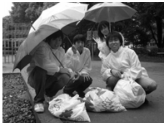
みんなで記念撮影。ゴミ袋いっぱいのゴミを拾うことができました!

また活動中に、たくさんの地域の方から感謝の言葉を言っていただきました。ありがとうございました!