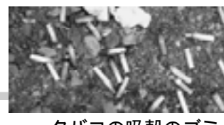
タバコの吸殻のゴミ。 至 佐津間