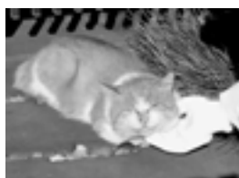
ありがたいにゃ~ 六実をきれいにしてくれれば、僕も気持ちよく散歩ができるにゃ。これからもよろしくにゃ!