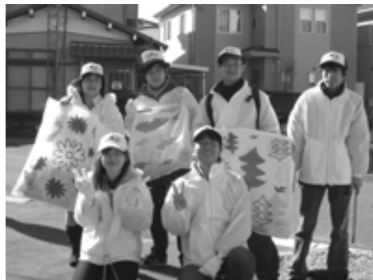
みんなで記念撮影。今回もたくさんのゴミを拾うことができました!

今回の活動中には、様々な地域の方々をお話する機会があり、楽しく活動ができました。また今回も私たちに今回も感謝や応援の言葉をかけてくださったみなさん、ありがとうございました!