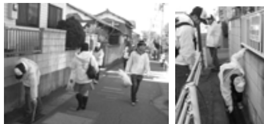
空きペットボトル、タバコの吸殻のゴミが多かったです。ドブなど取りにくいところも頑張って取りました!